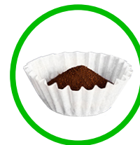
POSOS DE CAFÉ