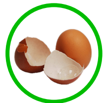
CÁSCARAS DE HUEVOS